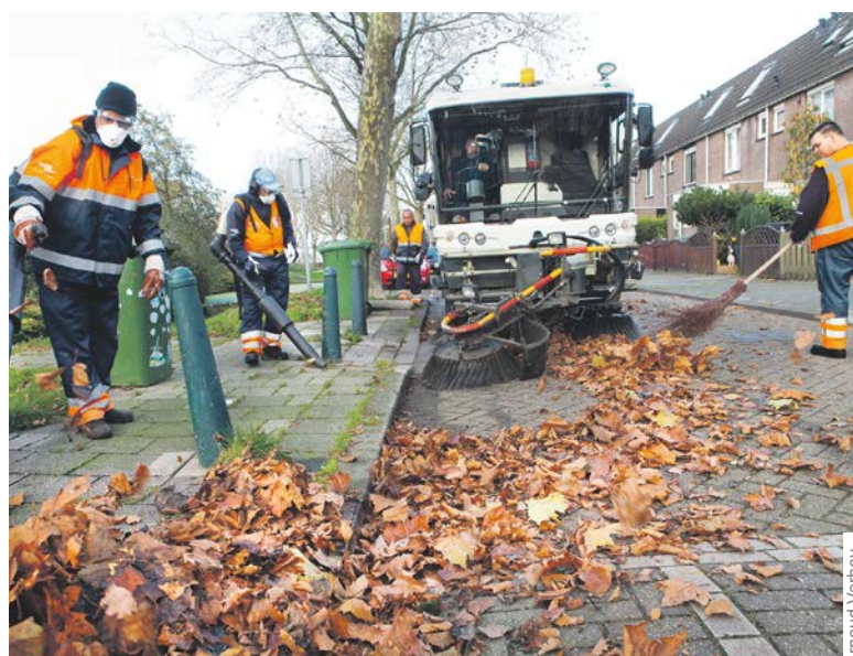
Op basis van digitale informatie wordt heel gericht schoongemaakt op plekken waar het echt nodig is.

Door de frequentie het van legen van de prullenbakken te verlagen, kan op andere plekken meer worden gereinigd, zonder dat dit ten koste gaat van het 'schoonniveau'. Zo wordt Rotterdam steeds slimmer schoon.