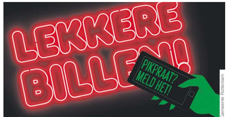
Vrouwen die te maken krijgen met intimidatie kunnen via de app direct een melding maken.

De StopApp maakt onderdeel uit van 'Pikpraat van straat', een campagne om seksuele straatintimidatie aan te pakken. Via www.stoppikpraat.nl kunt u de app downloaden. Voor algemene informatie: www.rotterdam.nl/wonen-leven/seksuelestraatintimidatie .