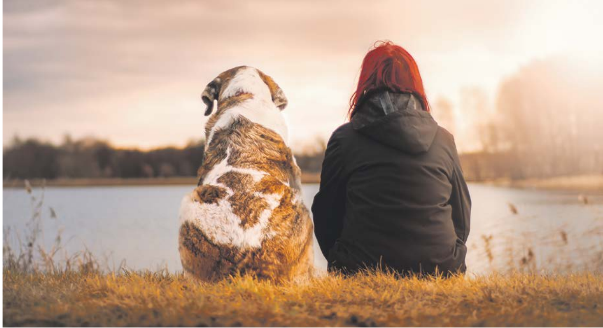
De afschaffing van de hondenbelasting is een van de veranderingen voor 2018.