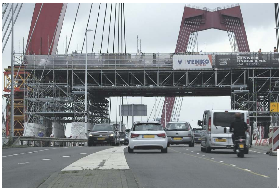
De steigers op de Willemsbrug worden de komende periode in een aantal nachten verwijderd.

De gemeente voert t/m 28 februari een aantal werkzaamheden uit op de Maeterlinckweg. Kolkleidingen worden aangelegd zodat het regenwater direct in de singel belandt. Daarnaast worden stoep en weg opnieuw bestraat en verkeersdrempels aangelegd. De weg is afgesloten tussen de Pascalweg