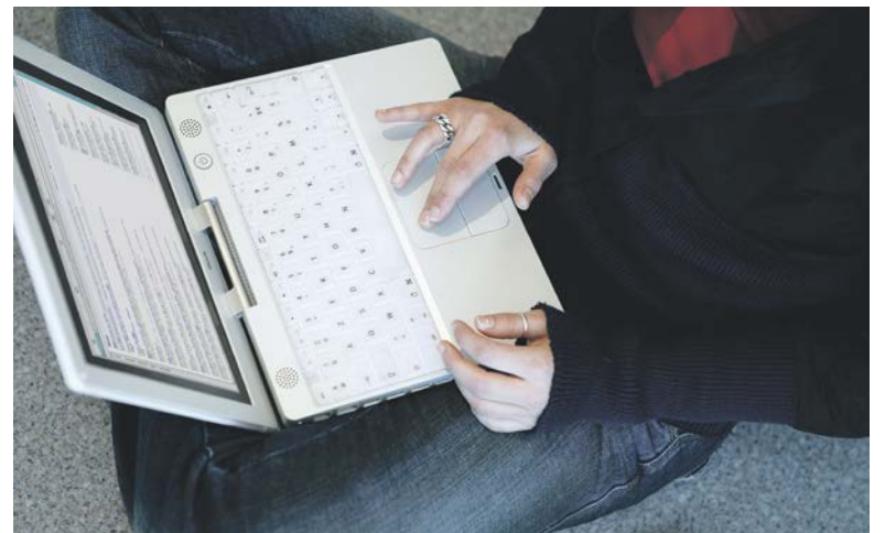
Via Mijn Loket kunt u uw belastingzaken prima vanuit huis regelen.

Oneens met uw aanslag? U kunt via Mijn Loket bezwaar maken. Uw gegevens worden dan meteen correct ingelezen. U kunt ook bewijsstukken bijvoegen om uw bezwaar mee te onderbouwen.